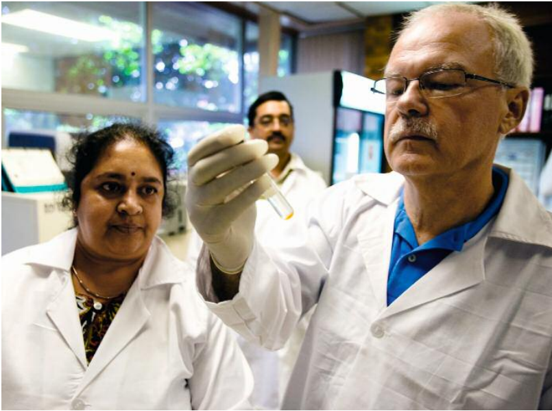
Infektionsbiologe Kaufmann: »VPM1002 ist anders«