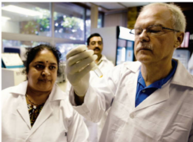
Infektionsbiologe Kaufmann: »VPM1002 ist anders«