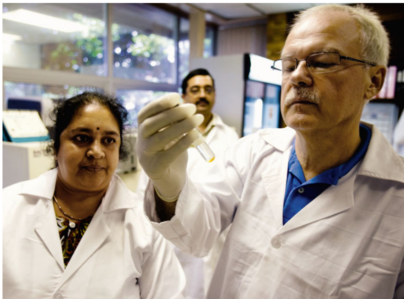
Infektionsbiologe Kaufmann: »VPM1002 ist anders«